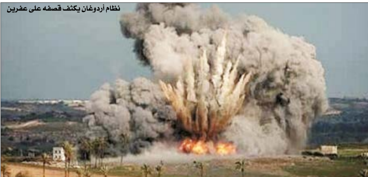
نظام اردوغان يكتف قصفه على عشرين

في درعا وريف القنيطرة وأسفرت الاعتداءات الجبانة عن استشهاد طفلة وشابة وإصابة ١٨ مدنياً بجروح معظمهم أطفال ونساء، تزامن ذلك مع مواصلة النظام الأروغاني خرقه للقرار ٢٤٠١ واستهدفت قواته بمختلف صنوف الأسلحة منطقة عفرين ما أدى إلى إصابة مواطنين والحاق أضرار مادية كبيرة بالملكات.