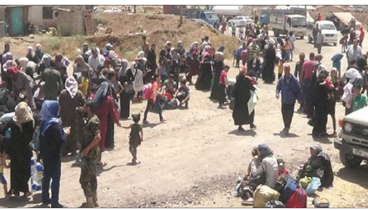
خروج عشرات العائلات من مناطق انتشار الإرهابيين في ريف درعا

صادرها الجيش. ويكتسب إنجاز الجيش في إعادة السيطرة على بلدة بصر الحرير وناحتة، اللتين كانتا تعتبران من أكبر معاقل الإرهابيين في الريف الشرقي، أهمية كبيرة إذ كانتا تعتبران نقطة وصل ما بين ريف درعا وبالتالي الجيش قطع طرق وخطوط الإمداد، فضلاً عن أهمية تطهير بصر الحرير في تأمين طريق إزرع السويداء المغلق منذ عام ٢٠١٣ وإعادة فتحه. وأفاد مراسل سانا بأن وحدات الجيش عثرت خلال عملية التشييط على مستودعات أسلحة وذخائر متنوعة، بعضها إسرائيلي الصنع، بينها قذائف آر بي جي وصواريخ تاو وقذائف دبابتها وهاون وصاروخية وكميات كبيرة من الذخيرة المختلفة إضافة إلى الغام مضادة للدروع والأفراد وعبوات ناسفة، وبين أن وحدات الجيش ثبتت نقاطاً جديدة في البلدتين كمراكز إيسناد لها، بينما تواصل وحدات أخرى توسيع نطاق سيطرتها جنوباً لدحر الإرهاب وإعادة الأمن والاستقرار لبقية قرى ريف درعا الشرقي وحماية الأهالي من اعتداءاتهم. وبين المراسل أن تطهير البلديتين مع غيرها من قرى ريف درعا الشرقي سيسهم في حماية الأهالي في ريف السويداء الغربي المتاخم ولا سيما الدور الحريمي وقراصة وتعارة والدويرة ونجران وغيرها، والذين عانوا على مدى السنوات السابقة من الاعتداءات الإرهابية المتكررة إما بقذائف الهاون أو زرع العبوات الناسفة أو نصب الكماثن وإطلاق الرصاص الحي والخطف على الطرقات وفي أراضيهم.