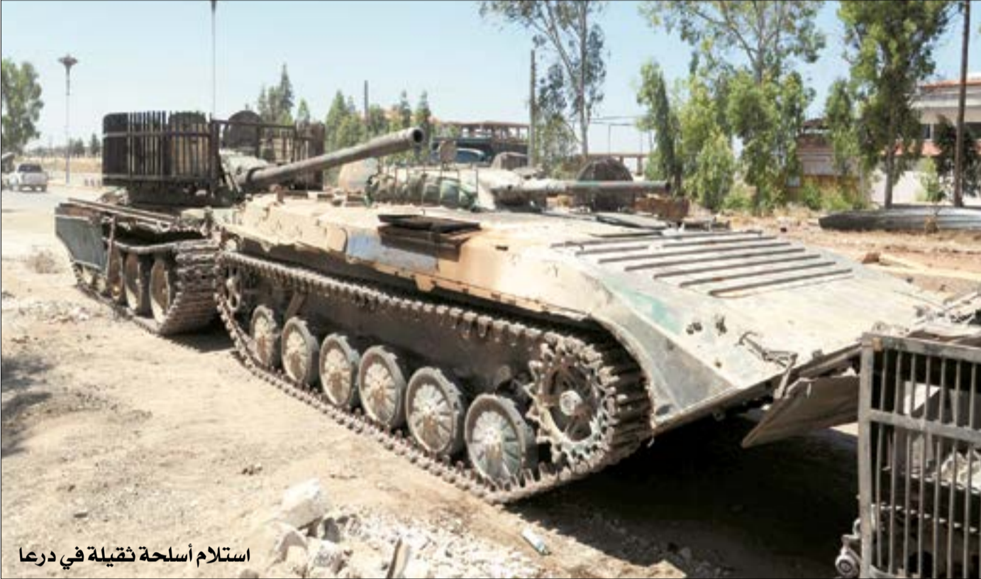
استلام أسلحة ثقيلة في درعا

وسّعت قواتنا الباسلة نطاق سيطرتها في ريفي درعا والقنيطرة، حيث بات أكثر من ٩٠ بالمئة من محافظة درعا تحت سيطرتها، فيما واصلت المجموعات المسلحة المنتشرة في منطقة درعا البلد تسليم أسلحتها الثقيلة والمتوسطة للجيش العربي السوري، وذلك في سياق الاتفاق الذي تمّ التوصل إليه، في وقت عثرت الجهات المختصة على أسلحة وذخائر من مخلفات الإرهابيين في بلدة عقرب بريف حماة الجنوبي، بعضها إسرائيلي الصنع.