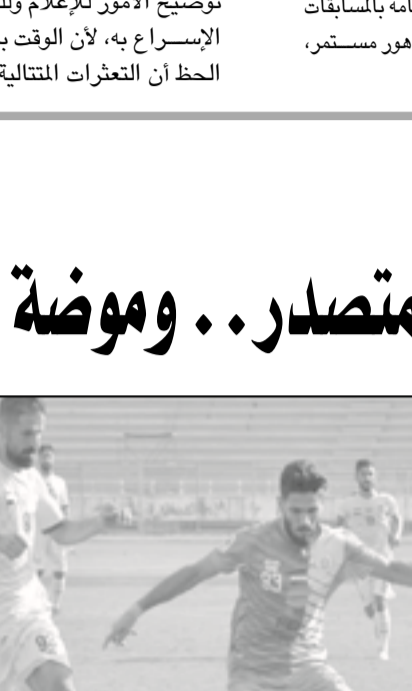
المنتخب الوطني في مباراة مع البحرين.