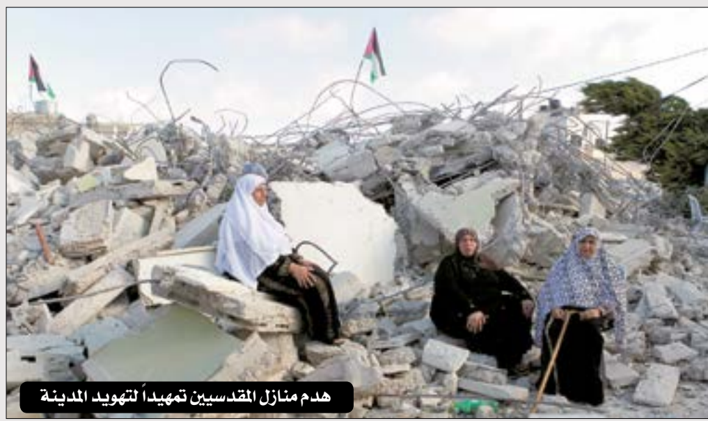
هدم منازل المتدسين تمهيداً لتفويده المدينة