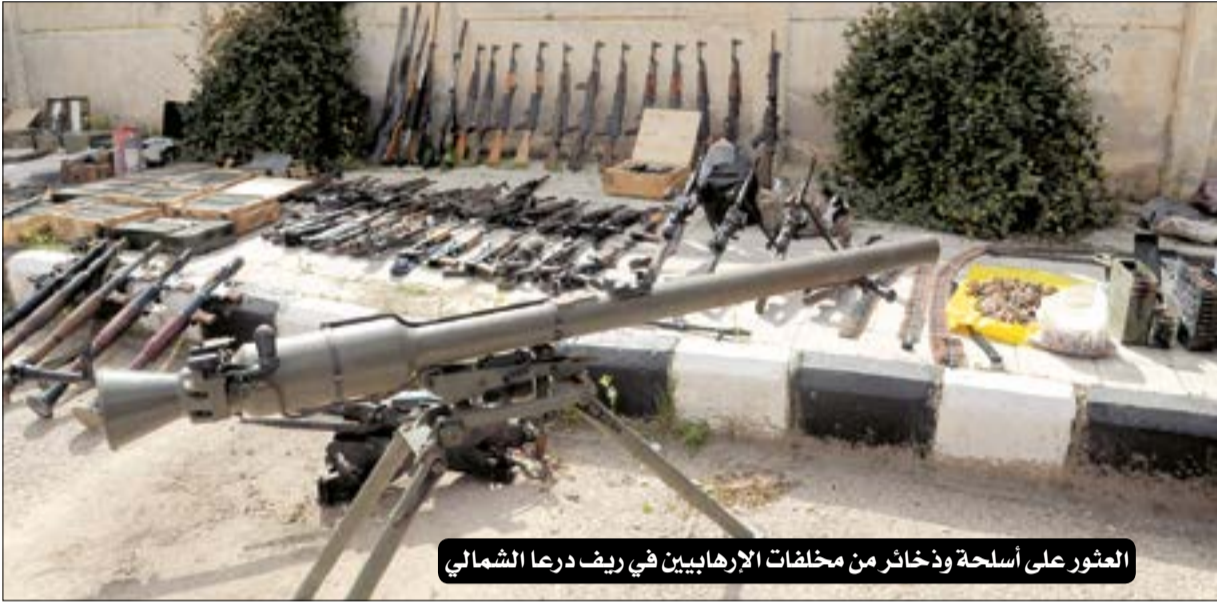
العثور على أسلحة وذخائر من مخلفات الإرهابيين في ريف درعا الشمالي

كانت بحوزتهم. كما استهدفت وحدة من الجيش فجر أمس بصليات صاروخية مركزة مقرات لإرهابيين النصر ومجموعات تتبع لهم في عمق مناطق انتشارها في بلدة حاس بريف ادلب الجنوبي ما أسفر عن تدمير عدة مقرات وأليات والقضاء على عدد من الإرهابيين وإصابة آخرين. خلال متابعة الجهات المختصة تمسيط القرى المحصرة من الإرهاب وبالتعاون مع الأهل في ريف درعا الشمالي تم العثور على أسلحة وذخائر منها رشاش بي كي سي ورشاش دوشكا وقاذف ار بي جي ٧ وقاذف مضاد للدروع وقنابل يدوية وقذائف ار بي جي مع حشواتها ومناظير ليلية وأجهزة اتصال وذخيرة متنوعة بعضها إسرائيلي الصنع كانت المجموعات الإرهابية خبأتها قبل اندحارها من بلدتي انخل والحارة.